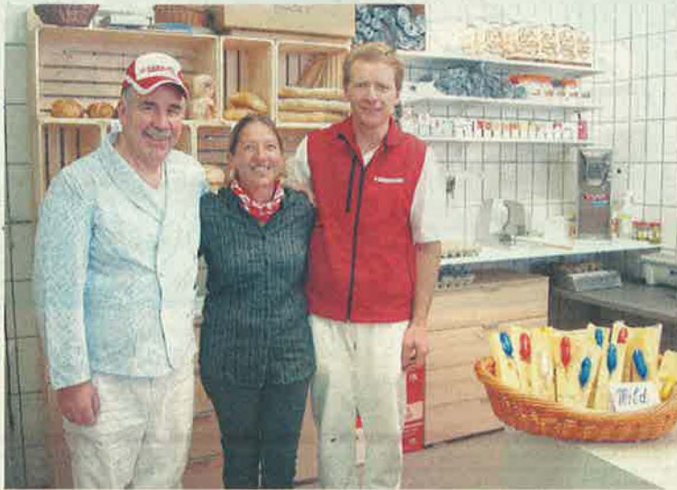
Die Käserei-Crew freut sich auf rege Kundschaft.

2014 war nicht nur geprägt von der Erweiterung des Käsereibetriebs